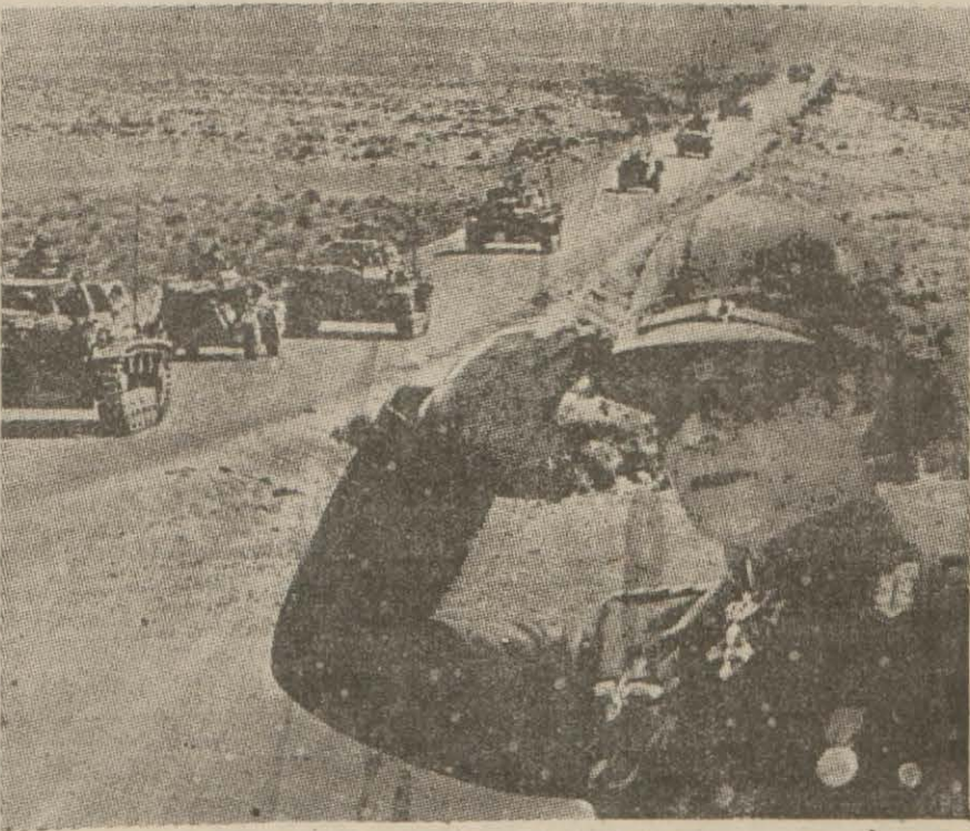
Mareşal Rommel ve Libyada hareket halinde bir Alman tank kolu

Londra 23 (A.A.) — Hava nezaretinin tebliği: Dünkü Pazartesi — Salı gecesi büyük bir hava teşkili Emden şehrine yeniden taarruz etmiştir. Bir saatten daha az bir zaman içinde mütemerkiz bir taarruz yapılmıştır. Yerde sis olmasına rağmen hava güzeldi. İyi intihab edilen yerlere atılan aydınlatıcı fişeklerin hedeflerin tanınması bakımından büyük bir yardımcı olmuştur. Holendada hava meydanlarına da taarruz edilmiştir. Av servisine mensub tayyareler Fransanın şimalinde hava meydanlarına ve diğer hedeflere hücum etmişlerdir.